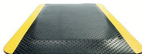
Czarny z żółtymi pasami