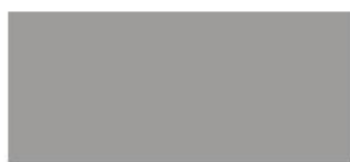
53 Szary Księżycowy Lunar Grey