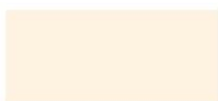
11 Vaniliowy Deser Vanilla Dessert